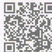
Страница канала YouTube