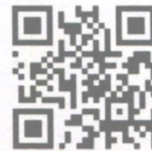
Страница сообщества «ВКонтакте»

Наиболее яркими проектами стали: – видеозанятия по произведениям детской