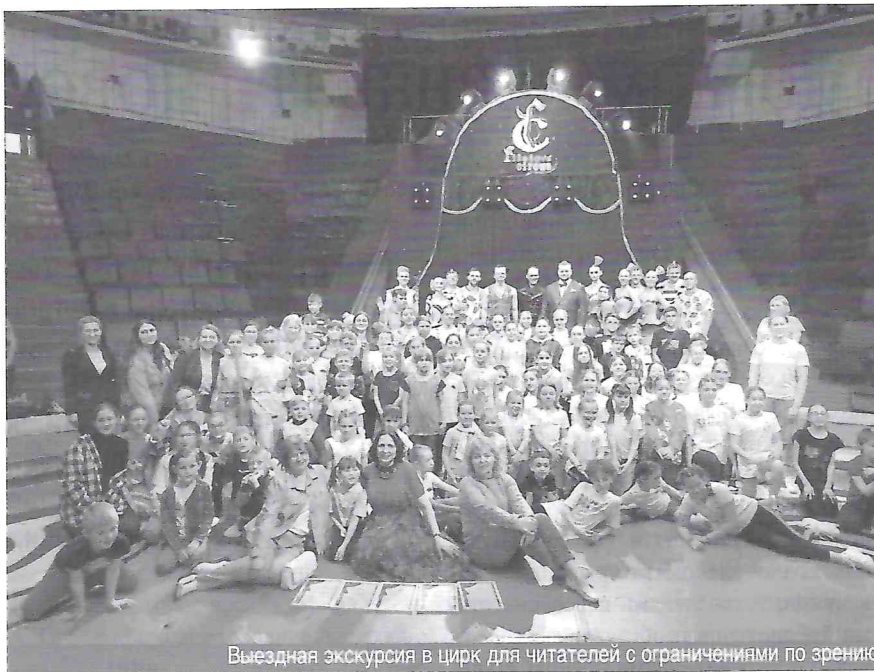
Выездная экскурсия в цирк для читателей с ограничениями по зрению

Всегда много и настоятельно на экскурсиях библиотекари рассказывают о важности для общего развития ребёнка, и, в особенности, для чтения и письма по Брайлю, разработки пространственной ориентировки, тренировки мелкой моторики, силы рук и при этом их чувствительности. Наглядные пособия, тематические бизборды, прикладные материалы самого разного толка, от круп и шишек, до конструкторов и высокоточных моделей, наряду с разнообразными настольными играми и тактильными