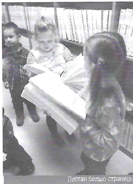
Листая белые страницы

ных, а самые смелые окунулись в купально. Выездная экскурсия подарила всем заряд бодрости, новых душевных сил, позитивной энергетики и хорошего настроения.