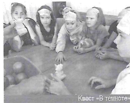
Квест «В темноте»

Для передачи в ходе экскурсии данных о системе библиотечного обслуживания россиян и особом в ней месте библиотек для слепых, для знакомства со структурой библиотеки, составом фондов, справочным аппаратом, продуктами и услугами для пользователей, — библиотекари-экскурсоводы не только стараются выбрать правильную интонацию и найти общий язык с экскурсантами, но и активно используют эмоциональную составляющую ознакомительной экскурсии и мощный эффект новизны. Даже самые пассивные участники