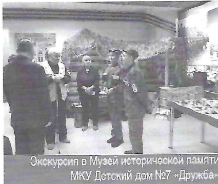
Экскурсия в Музей исторической памяти МКУ Детский дом №7 «Дружба»

С уверенностью можно сказать, что Специальная библиотека является средоточием культурной жизни незрячих и слабовидящих. Именно здесь, помимо реализации конституционного права на доступ к информации, организуется и