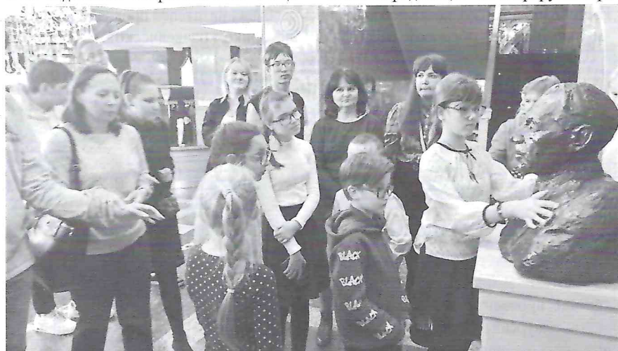
Выездная экскурсия «За кулисами театра» в Музыкальный театр Кузбасса

екта «Доступный театр» более 400 человек посмотрели 17 спектаклей с прямым тифлокомментарием в Театре драмы Кузбасса им. А. В. Луначарского (г. Кемерово), Новокузнецком и Прокопьевском драматических театрах. Освоено и проведение междугородних выездных экскурсий: при поддержке региональных отделений Всероссийского обще-